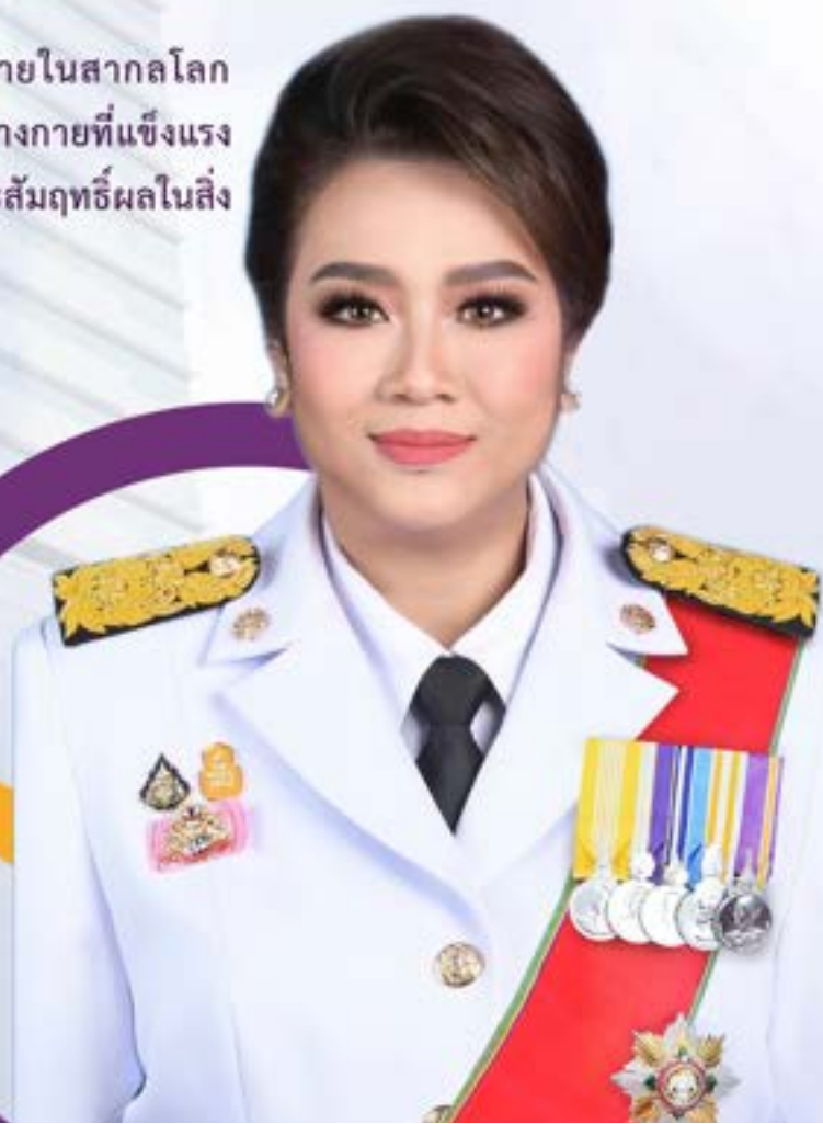
นางสาวศุภมาส อิศรภักดี รัฐมนตรีว่าการกระทรวงการอุดมศึกษา วิทยาศาสตร์ วิจัยและนวัตกรรม

ท้ายสุดนี้ ขออาราธนาสิ่งศักดิ์สิทธิ์ทั้งหลายในสากลโลก คลบันดาลให้ผู้เกษียณอายุราชการทุกท่าน มีสุขภาพร่างกายที่แข็งแรง มีพลังใจ ที่เข้มแข็ง ประสบแต่ความสุขความเจริญและสัมฤทธิ์ผลในสิ่ง อันพึงปรารถนาทุกประการ